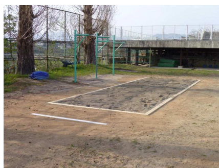
〈改修工事が終了し、整備された砂場：4 / 2撮影〉

3 / 17 第58回兵庫県支部対抗 中学女子ソフトボール大会 東中1-17松崎・荒牧中